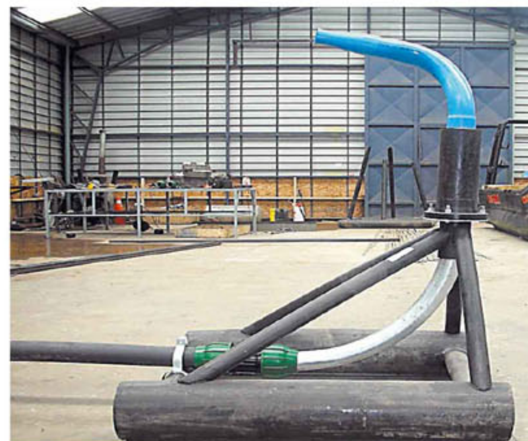
Dispersor de alimentos DA1-90

Para mayor información sobre sus productos y servicios, invitamos a visitar su portal Web, www.calbuplas.cl , o a través de su correo electrónico de contacto: empresa@calbuplas.cl