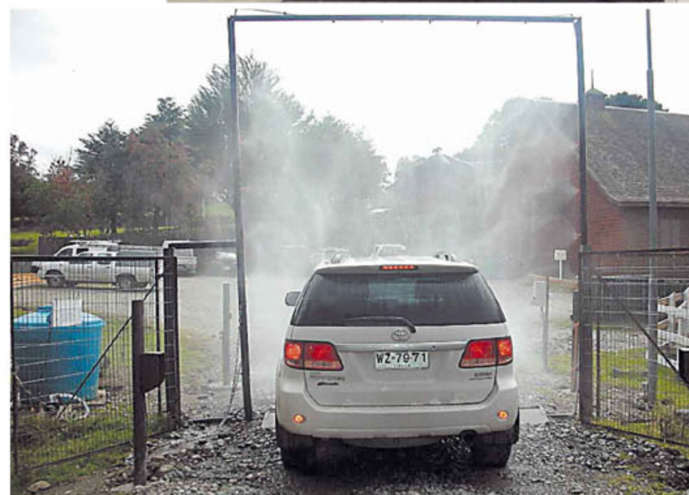
Desinfección de vehículos automática.